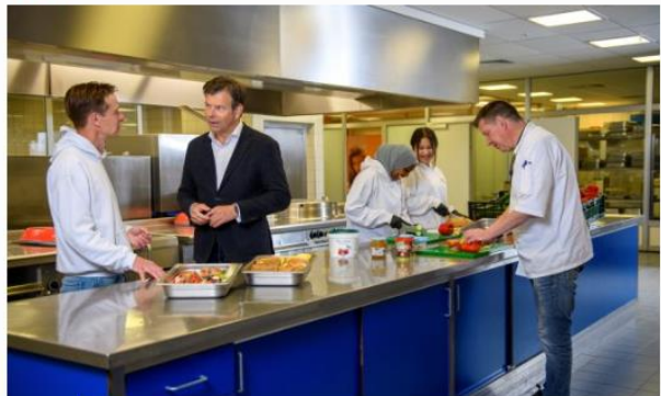
De wereld een stukje mooier maken en gezond eten als eigen keuze

In samenwerking met Albron - Medewerkers die zwaar werk verrichten in een distributiecentrum dat 24/7 draait hebben andere eetpatronen en -behoeften dan bijvoorbeeld partners van een advocatenkantoor. "Maar overal zien we een verschuiving in eetpatronen en daar speelt Albron op in."