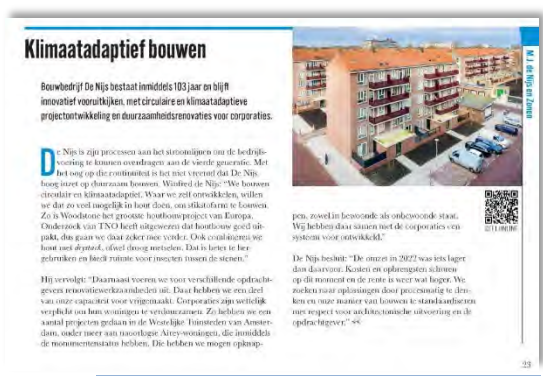
3/1 pagina in het magazine

De onderneming is er voor u van de eerste tot de laatste kilometer. Dit is de filosofie van Mercedes-Benz. De onderneming is er voor u van de eerste tot de laatste kilometer. Dit is de filosofie van Mercedes-Benz.